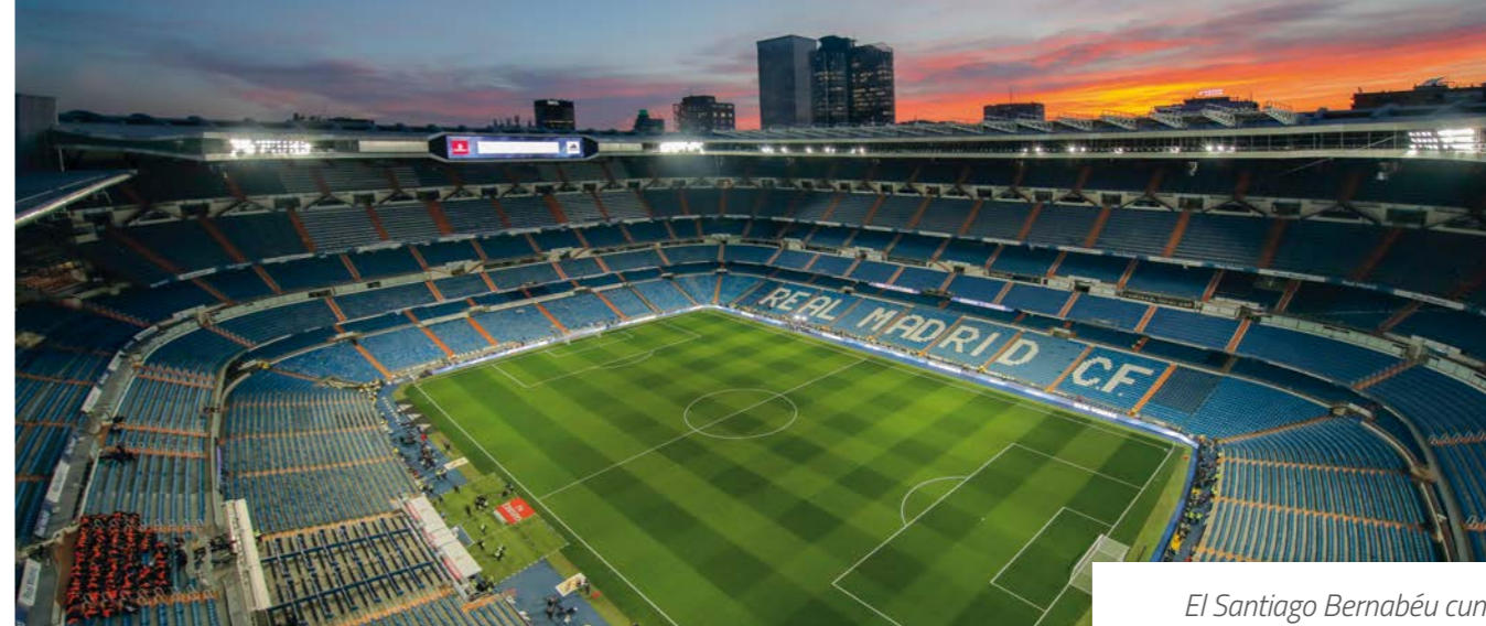
El Santiago Bernabéu cumplió 72 años durante esta temporada.

En esta temporada ha aumentado la inversión del club en la formación continua de su plantilla. Esta inversión ha superado los 740.000 euros y cerca de 18.000 horas dedicadas a formación en la temporada. Los principales esfuerzos en formación se han orientado a contribuir a la estrategia, apoyando los planes de internacionalización del negocio y las operaciones del club, por una parte, e impulsando la transformación digital de toda nuestra organización por otra.