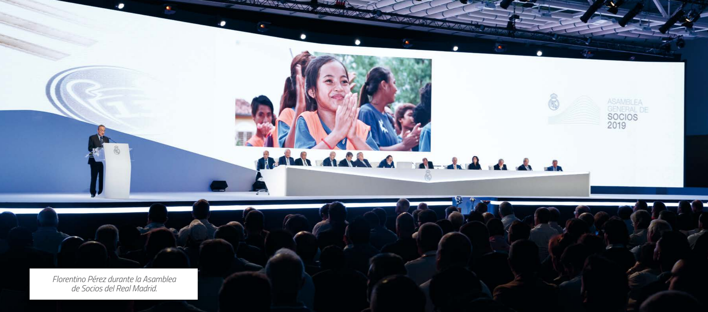
Florentino Pérez durante la Asamblea de Socios del Real Madrid.