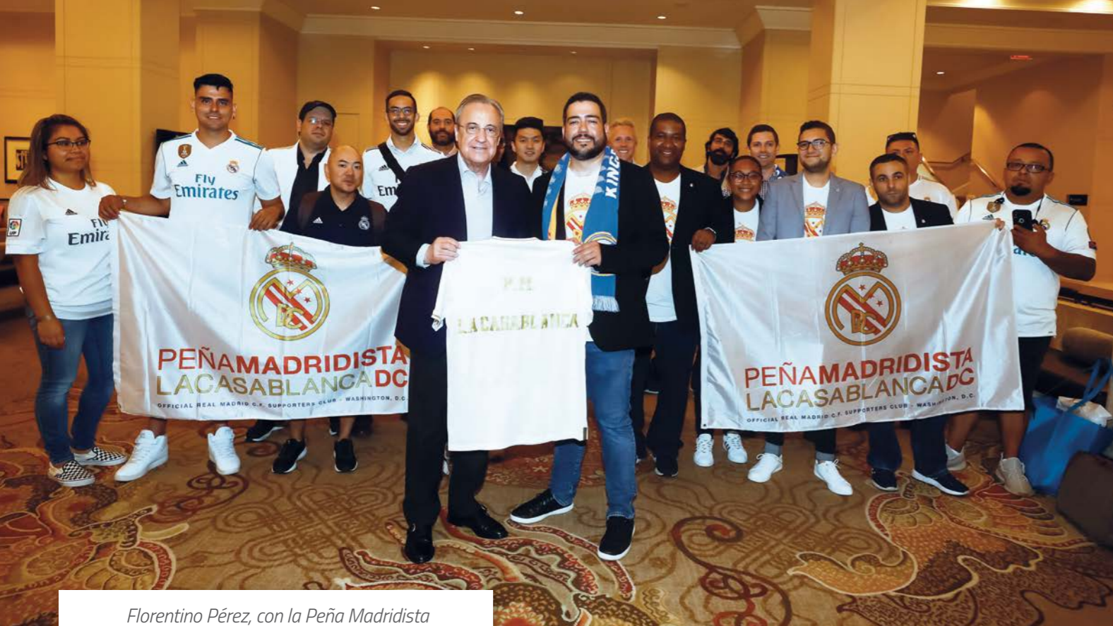
Florentino Pérez, con la Peña Madridista La Casa Blanca de Washington.

Debemos destacar que a través de nuestro servicio telefónico se han atendido más de 14.000 llamadas, y más de 28.000 correos, donde ofrecemos a nuestros aficionados una información, de los temas relacionados con el club, desde fechas de salida de venta de entradas, como obtener la condición de Madridista, o bien dónde dirigirse para realizar las pruebas de acceso.