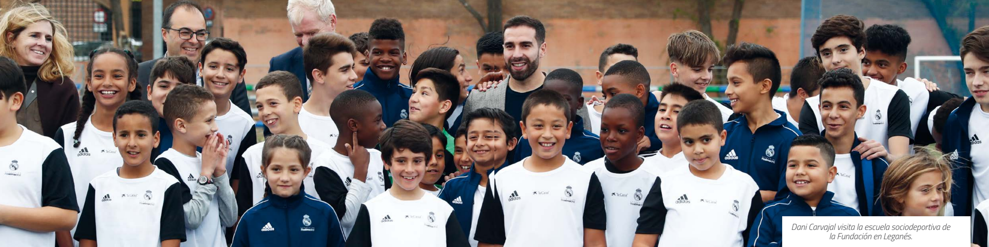
Dani Carvajal visita la escuela sociodeportiva de la Fundación en Leganés.

de AENOR, reconociendo la excelencia en la gestión de sus procesos, su fuerte orientación hacia la transparencia y a la actuación ética, aportando confianza a sus grupos de interés.