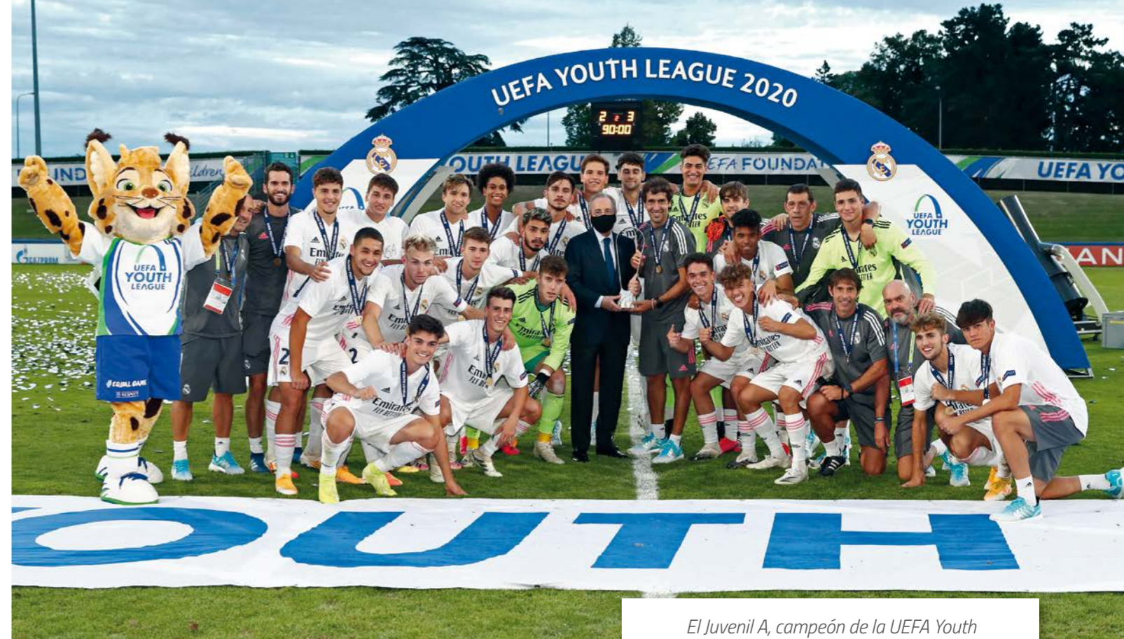
El Juvenil A, campeón de la UEFA Youth League 2019-20.

El Juvenil B y el Juvenil C también fueron declarados campeones de sus respectivas competiciones al encontrarse en la primera posición de la clasificación en el momento del parón, con más puntos en las mismas jornadas que el resto de los equipos. Diferente