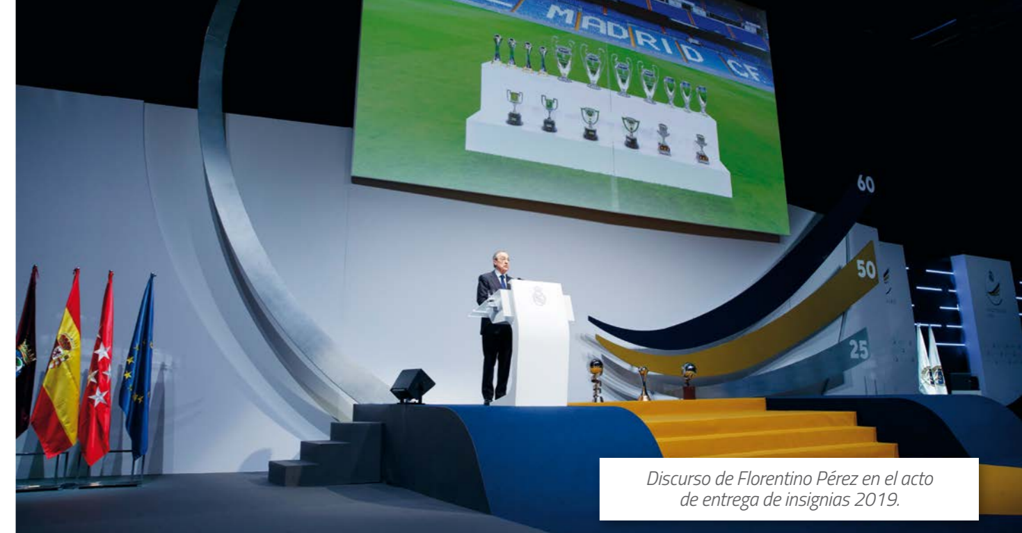
Discurso de Florentino Pérez en el acto de entrega de insignias 2019.

El pasado 16 de noviembre de 2019 se celebró el acto de entrega de insignias a todos los socios que cumplieron 25, 50 y 60 años de afiliación al club. Se concedieron 2.930 insignias, de las cuales 127 fueron de oro y brillantes, 337 de oro y 2.466 de plata.