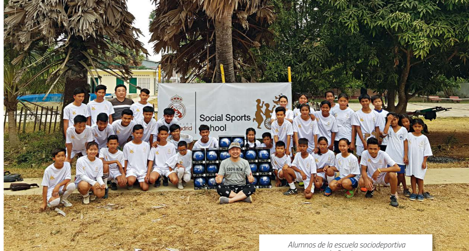
Alumnos de la escuela sociodeportiva de Camboya.

Las escuelas sociodeportivas de fútbol y baloncesto de la Fundación Real Madrid en España atienden a todos los niños y niñas que, sean cuales sean sus circunstancias o capacidades, desean aprender fútbol o baloncesto en valores con el escudo del Mejor Club del siglo XX. Los entrenadores-educadores son formados específicamente por el Área de Formación de la Fundación Real Madrid para implementar la metodología de la Fundación Por una educación REAL: Valores y Deporte en las diferentes disciplinas, trabajando los valores propios del madridismo y del deporte de equipo (respeto, compañerismo, trabajo en equipo, motivación, esfuerzo, autonomía responsable,