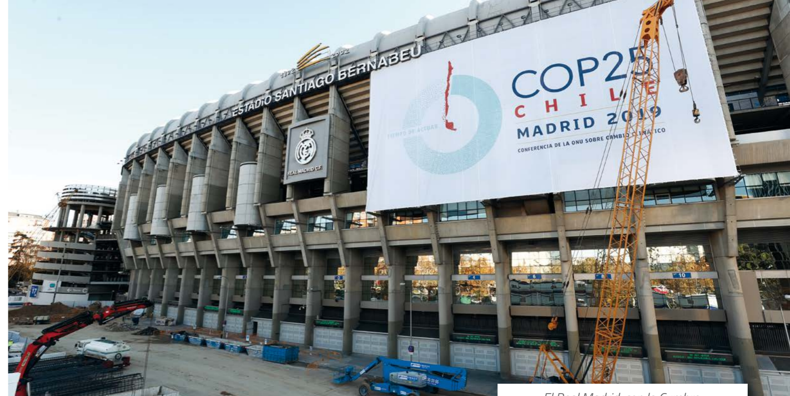
El Real Madrid, con la Cumbre del Clima (COP25).

Real Madrid mantiene desde 2007 un convenio con Ecoembes España, S. A. para la implan-