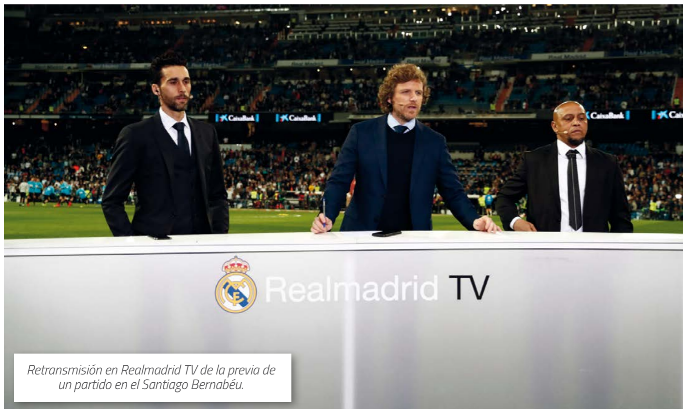
Retransmisión en Real Madrid TV de la previa de un partido en el Santiago Bernabéu.