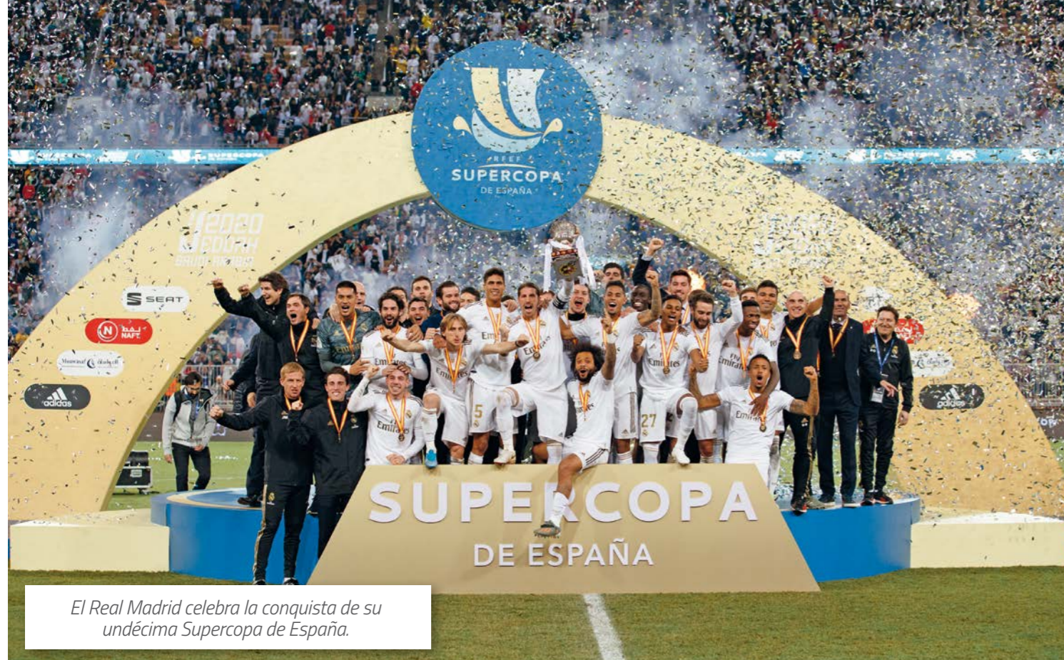
El Real Madrid celebra la conquista de su undécima Supercopa de España.