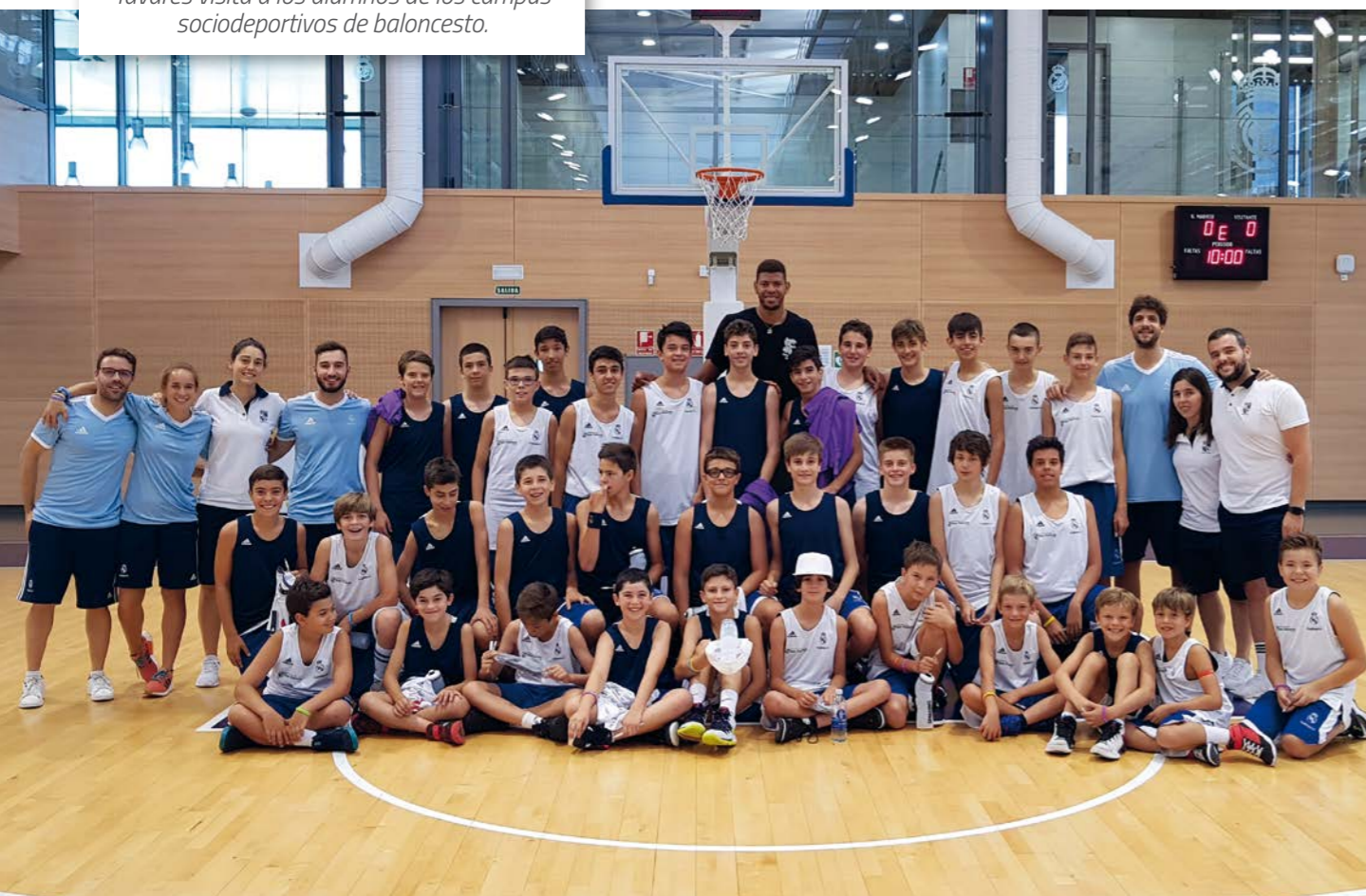
Tavares visita a los alumnos de los campus sociodeportivos de baloncesto.

La realización de campus de verano y clínicas completó la oferta educativa de la Fundación para atender a todos los menores. Los campus albergaron al comienzo de temporada en torno a 4.000 participantes, mientras que la Ciudad Deportiva del Real Madrid fue el escenario de más de 100 clínicas para grupos y equipos ya iniciados, antes de la declaración del estado de alarma.