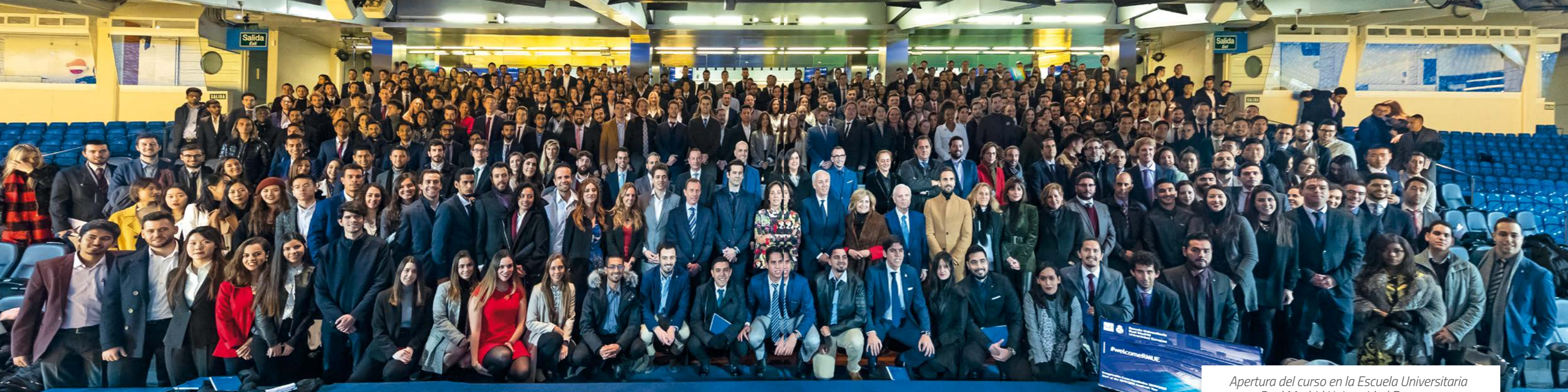
Apertura del curso en la Escuela Universitaria Real Madrid Universidad Europea.