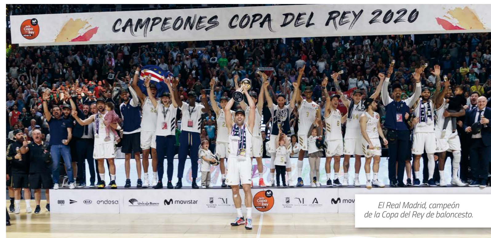
El Real Madrid, campeón de la Copa del Rey de baloncesto.

Esta temporada, el Real Madrid adquirió los derechos de tres jugadores para el primer equipo: Nicolás Laprovittola, Jordan Mickey y Salah Mejri. Los canteranos Usman Garuba y Mario Nakic se integraron en la primera plantilla tras formar parte del equipo EBA de la campaña anterior.