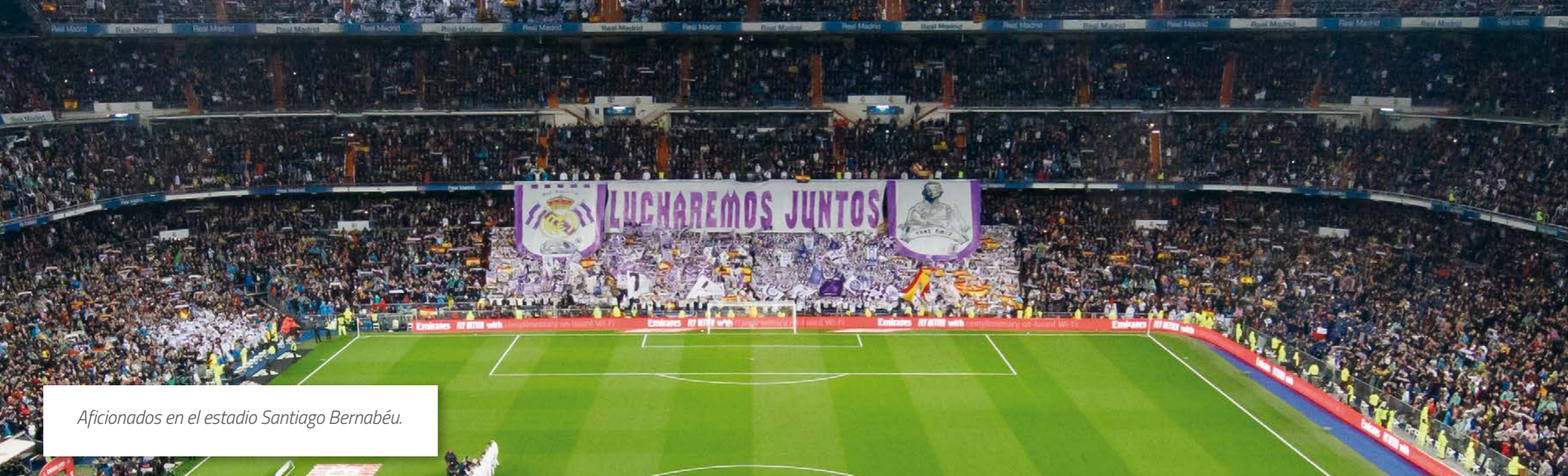
Aficionados en el estadio Santiago Bernabéu.