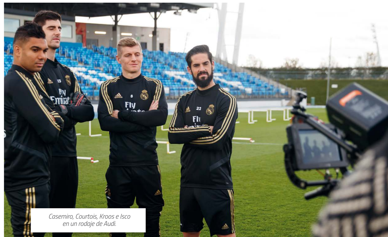
Casemiro, Courtois, Kroos e Isco en un rodaje de Audi.

Con esta audiencia y la capacidad de generar contenido adaptado a cada canal, se ha superado la cifra de 4.700 millones de reproducciones de vídeo. Mención especial merece junio, cuando generamos 208 millones de reproducciones, marcando un nuevo récord mensual para cualquier club deportivo en la plataforma. Esta temporada se ha abierto una cuenta de Twitch, la plataforma de distribución de contenido en directo (propiedad de Amazon) enfocada al sector del gaming , con el objetivo de ganar presencia en él y llegar a un público más amplio. Durante esos meses amplificamos competiciones de eSports donde participaban nuestros jugadores y lanzamos RMPlayground , un espacio donde generábamos contenido alrededor de una partida de FIFA20. En el primer episodio, Marco Asensio recibió al piloto de Fórmula 1 Carlos Sainz. Hacia el final de La Liga hemos seguido adaptando contenido a la plataforma, aprovechando su carácter interactivo y solicitando cada vez más la participación de los fans.