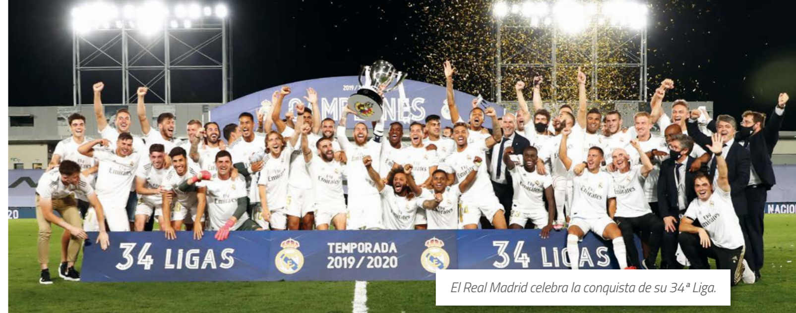
El Real Madrid celebra la conquista de su 34ª Liga.

El Real Madrid ofrece a todos los aficionados al deporte su adhesión a los principios de la competición basada en el juego limpio, aportando siempre su mejor esfuerzo para promover los valores deportivos, la transparencia informativa, el respeto y la mayor seguridad en los eventos que organiza. Con aquellos seguidores adscritos al programa Madridista, el Real Madrid mantiene una relación más estrecha facilitándoles infor-