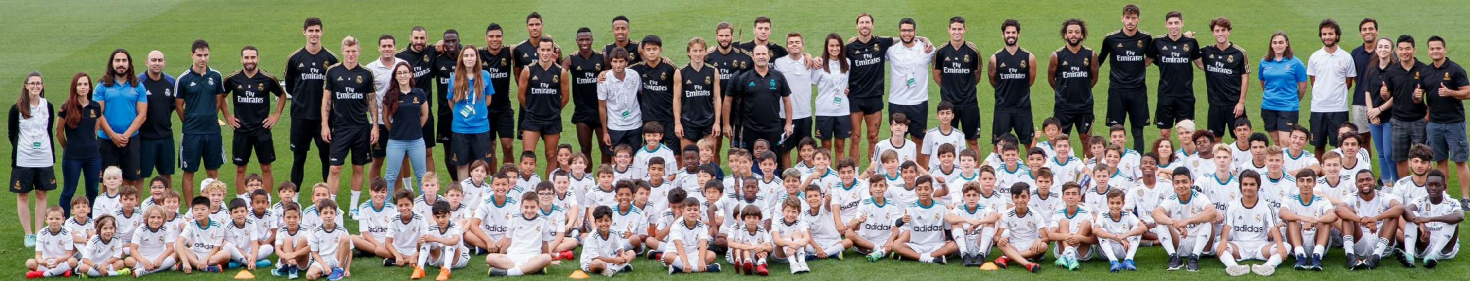
Jugadores del Real Madrid en los campus de la Fundación Real Madrid.

la participación en sesiones de entrenamiento de fútbol y baloncesto. Y todo ello a través de su inclusión en actividades socioeducativas, entre las que cabe destacar el refuerzo escolar, apoyo psicológico, la distribución de meriendas nutritivas, los exámenes médicos o la orientación de integración y apoyo sociofamiliar.