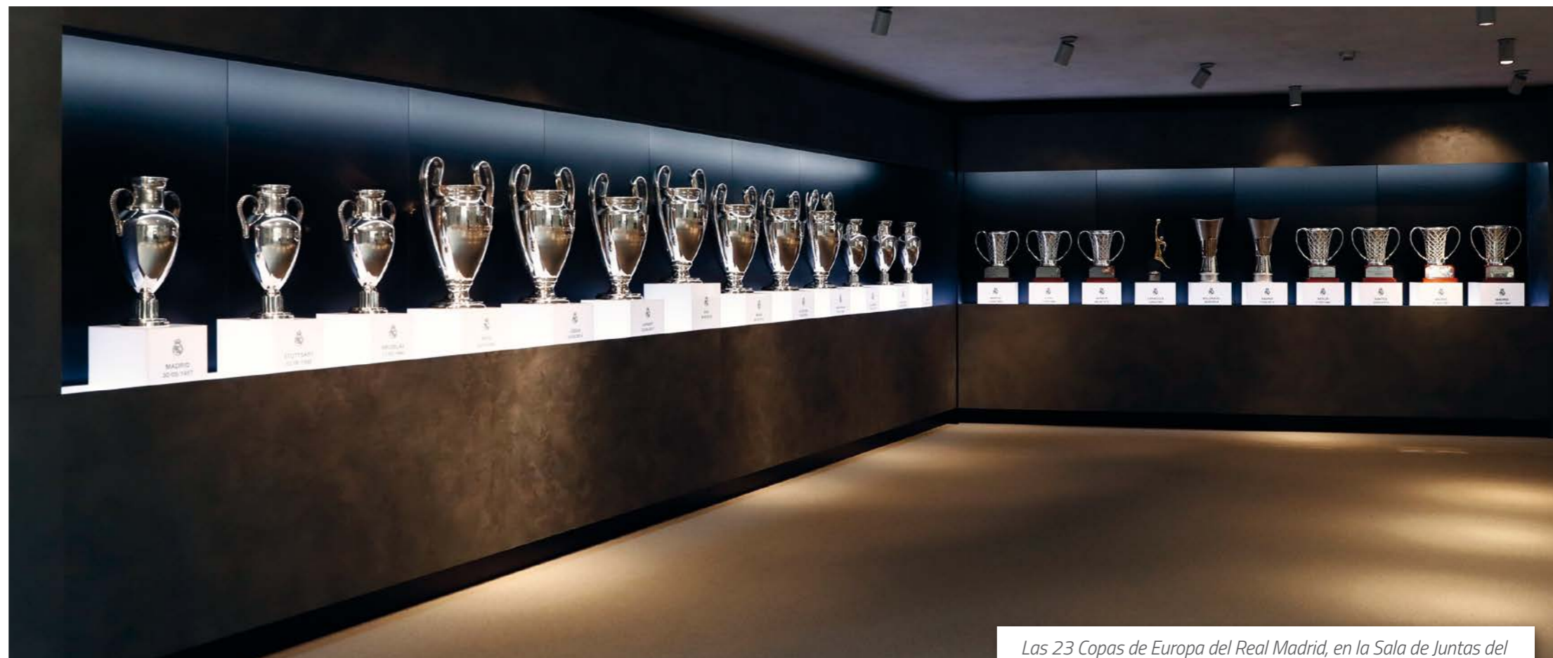
Las 23 Copas de Europa del Real Madrid, en la Sala de Juntas del edificio de oficinas corporativas de la Ciudad Real Madrid.

El Real Madrid Club de Fútbol, fundado en marzo de 1902 y cuya primera acta fundacional lleva fecha de 18 de abril del mismo año, goza de personalidad jurídica de acuerdo con la legislación vigente, estando adscrito a la Federación Española de Fútbol, así como a las federaciones que lo exijan, según las distintas secciones deportivas que el club tenga establecidas en cada temporada.