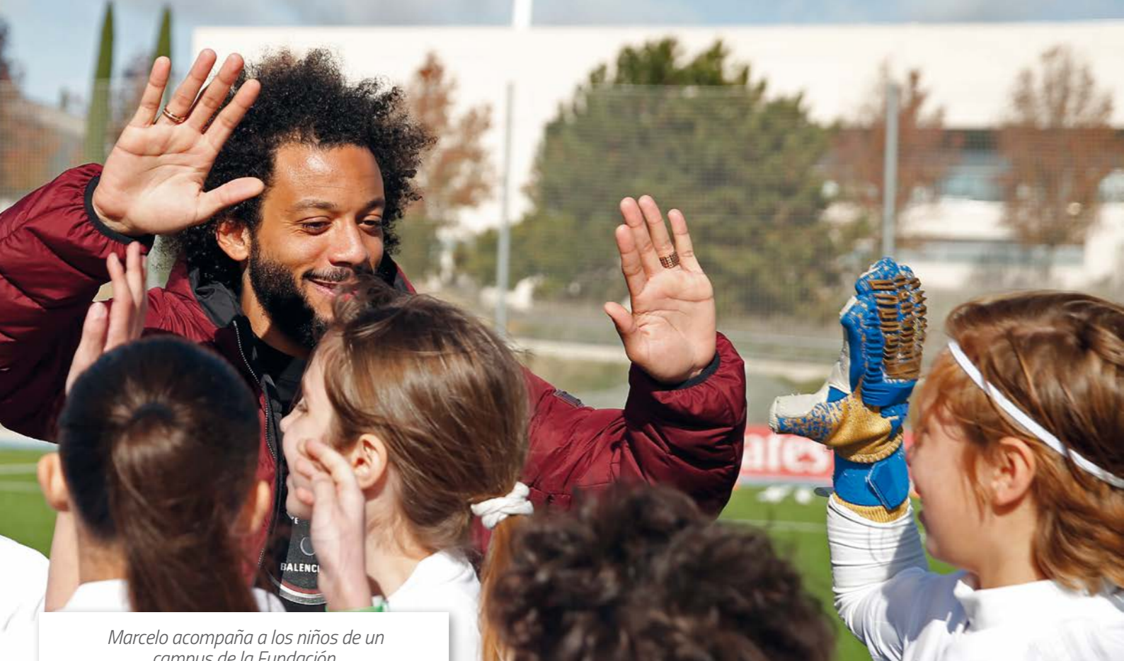
Marcelo acompaña a los niños de un campus de la Fundación.

También se han firmado dos nuevos convenios: en Reino Unido con Kinetic Foundation; y en Italia con las asociaciones Portofranco y Fatima Tracia, y que celebraron un evento de inauguración con Álvaro Arbeloa.