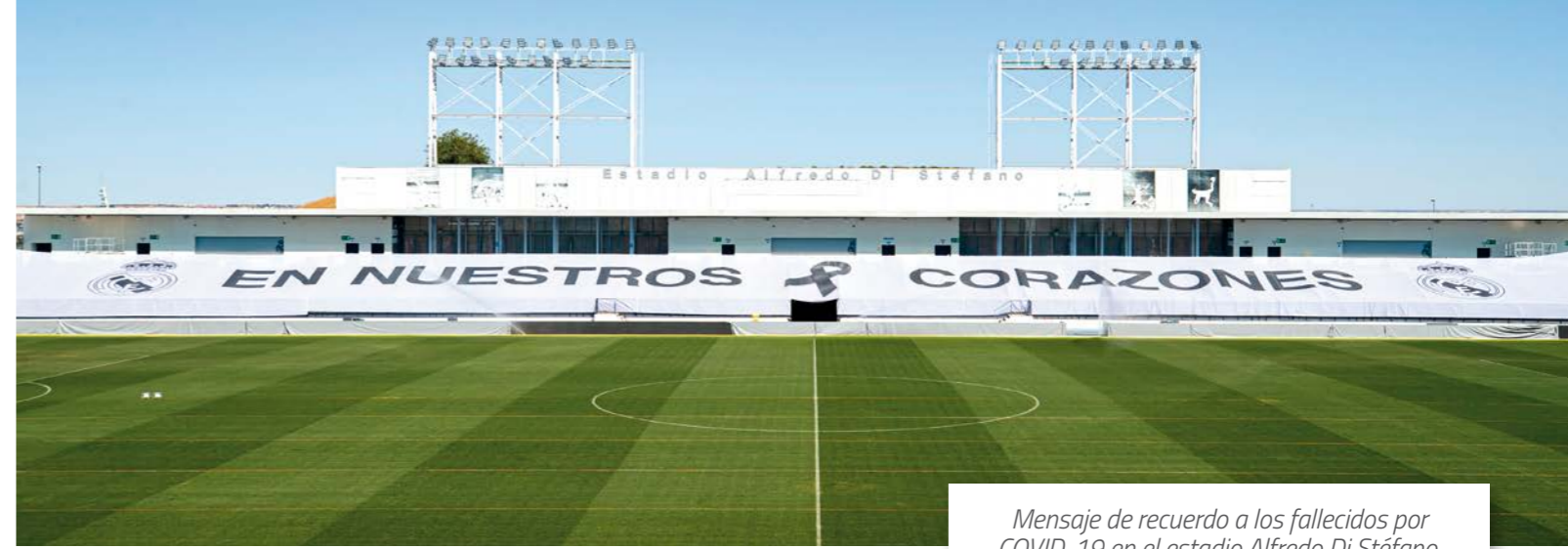
Mensaje de recuerdo a los fallecidos por COVID-19 en el estadio Alfredo Di Stefano.

y lucha contra la corrupción. De los 10 principios, 4 corresponden a las condiciones de trabajo. Esta es la categoría más numerosa y que dota al Pacto Mundial de un profundo significado laboral, suponiendo un compromiso muy firme con las obligaciones de la organización como empleador.