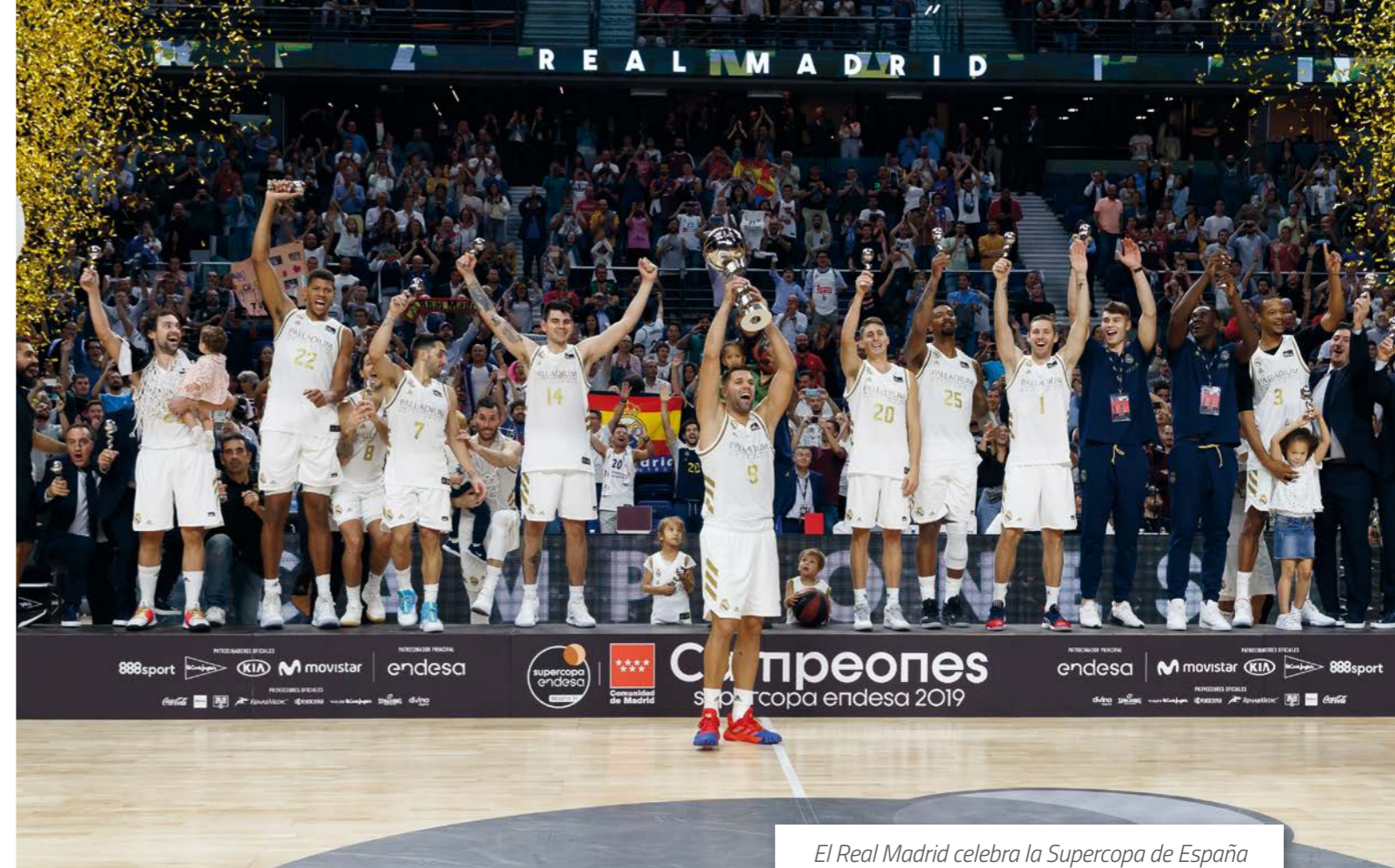
El Real Madrid celebra la Supercopa de España de baloncesto por sexta vez.

En una temporada tan complicada como la actual, el club ha seguido dando muy buenas noticias en lo referente a patrocinios. Actualmente, 23 marcas confían en el Real Madrid como vehículo de comunicación. Colaboradores de las secciones de fútbol y baloncesto masculino, a las que por primera vez se