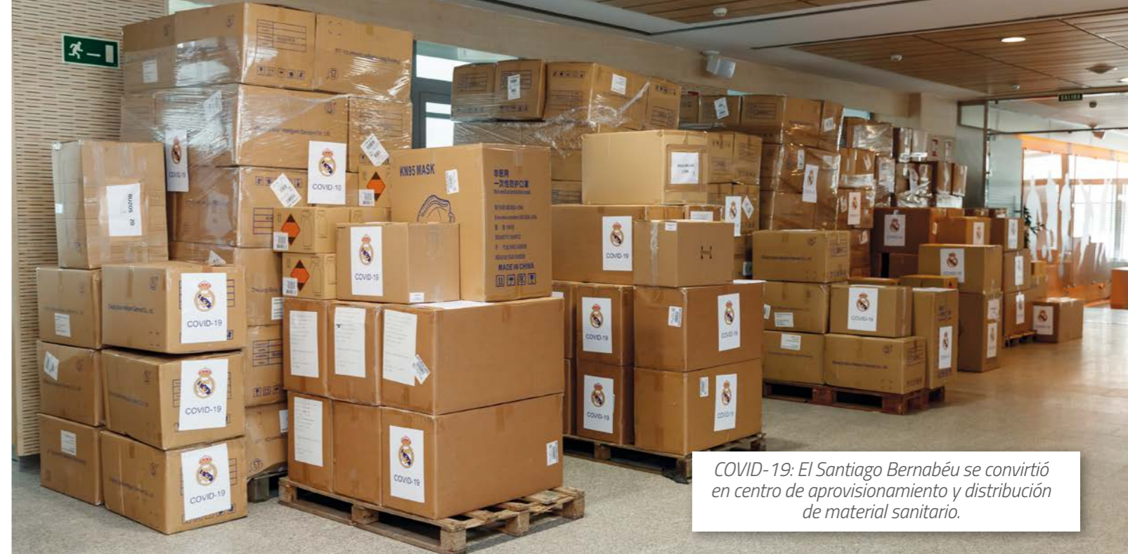
COVID-19: El Santiago Bernabéu se convirtió en centro de aprovisionamiento y distribución de material sanitario.

El cumplimiento de las normas de buen gobierno corporativo se manifiesta, también, en todas las fases del ciclo presupuestario, desde su elaboración, siguiendo las directrices fijadas por la Junta Directiva y realizada con la participación de todas las direcciones del club, hasta su aprobación por la Asamblea de Socios Representantes a propuesta de la Junta Directiva, así como su posterior seguimiento, detección de posibles