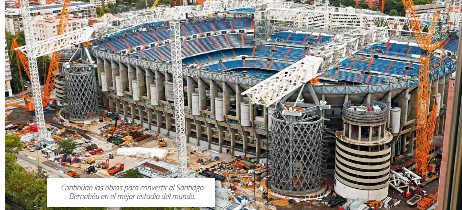
Continúan las obras para convertir al Santiago Bernabéu en el mejor estadio del mundo.

Para el futuro, la Dirección de Medioambiente ha diseñado nuevos planes de acción que se encuentran todavía en fases iniciales, pero que asegurarán el mantenimiento del compromiso del Real Madrid con el cuidado de la naturaleza. Entre ellos