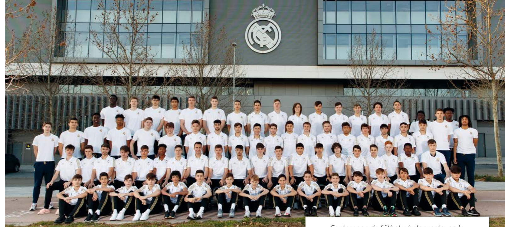
Canteranos de fútbol y baloncesto, en la residencia de la cantera de la Ciudad Real Madrid.

El acuerdo que el club mantiene con Sanitas se ha desarrollado con total satisfacción.