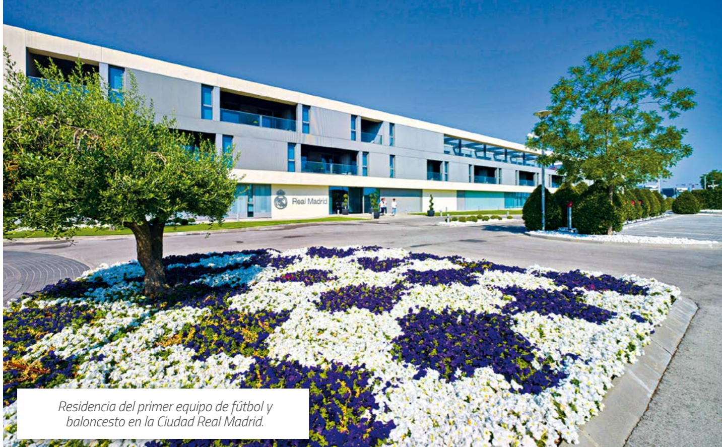
Residencia del primer equipo de fútbol y baloncesto en la Ciudad Real Madrid.

etc., con lo que aseguramos el correcto destino de dichos residuos.