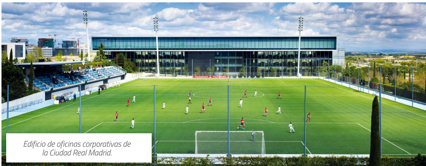
Edificio de oficinas corporativas de la Ciudad Real Madrid.

Durante los siguientes 103 días, la plantilla de empleados del club tuvo un comportamiento ejemplar que permitió el cumplimiento de todos los compromisos del Real Madrid y el funcionamiento administrativo de todas sus operaciones, manteniendo la comunicación con nuestros grupos de interés y preservando todas las capacidades del club para el reinicio inmediato de sus actividades en cuanto resultara posible. Únicamente los servicios básicos de seguridad y mantenimiento de instalaciones continuaron con su actividad a través del trabajo presencial, dentro de lo permitido en el confinamiento decretado durante el estado de alarma.