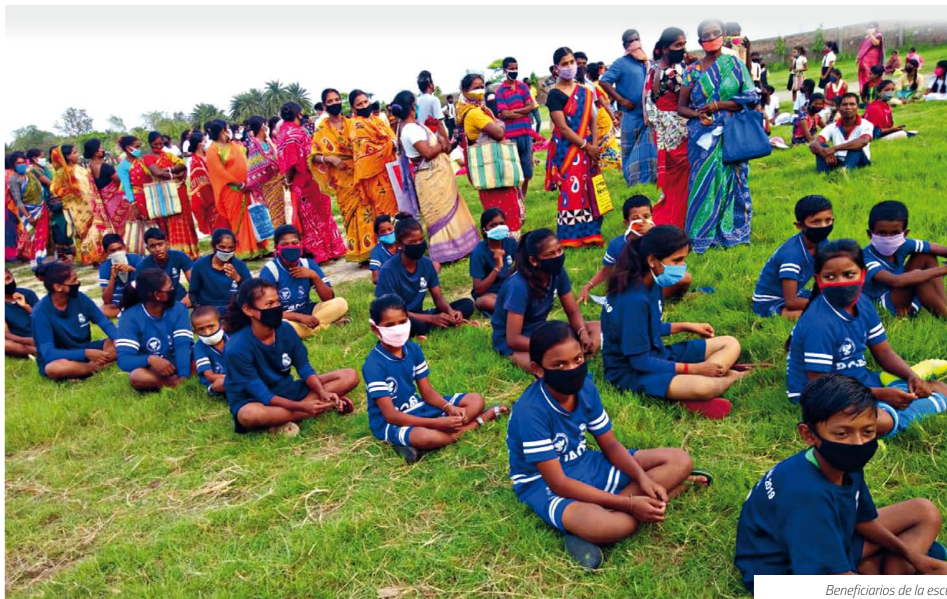
Beneficiarios de la escuela de Calcuta (India).

La Fundación está auditada anualmente y presenta los resultados de la auditoría a su Patronato, y al Protectorado de Fundaciones del Ministerio de Educación y Deporte, y adicionalmente se publican en la Memoria Anual de la Fundación. Asimismo, la Fundación Real Madrid cuenta con