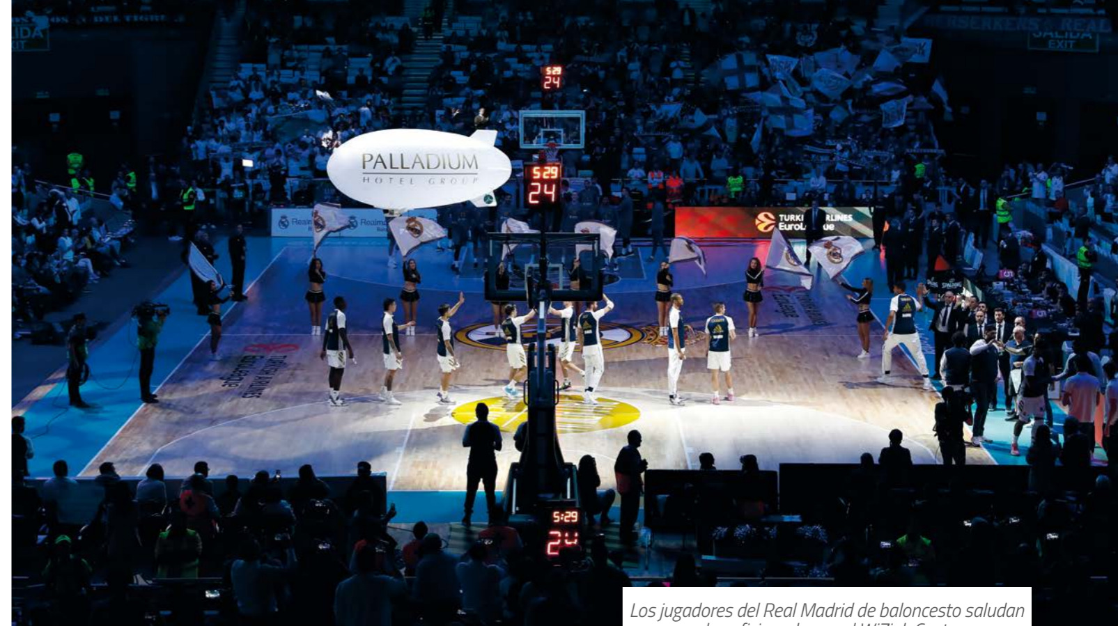
Los jugadores del Real Madrid de baloncesto saludan a los aficionados en el WiZink Center.

El Área VIP del Real Madrid comercializa 4.698 butacas distribuidas por todos los anillos del estadio Santiago Bernabéu y 594 localidades VIP de baloncesto en el Palacio de los Deportes de Madrid (WiZink Center). Las plazas VIP del San-