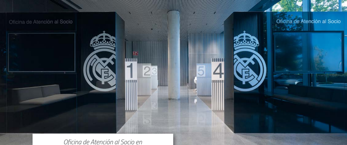
Oficina de Atención al Socio en la Ciudad Real Madrid.

y financiera, de contratos, de retribuciones, de compromisos éticos y de valores, o de gestión y servicios, yendo mucho más allá de las prescripciones y normativas. Este compromiso con la transparencia, se ve refrendado con la publicación en el Portal de Transparencia de todos los indicadores exigidos por el INFUT de Transparencia Internacional, en cuya última auditoría a todos los clubes de Primera y Segunda División, el Real Madrid ha obtenido la más alta puntuación.