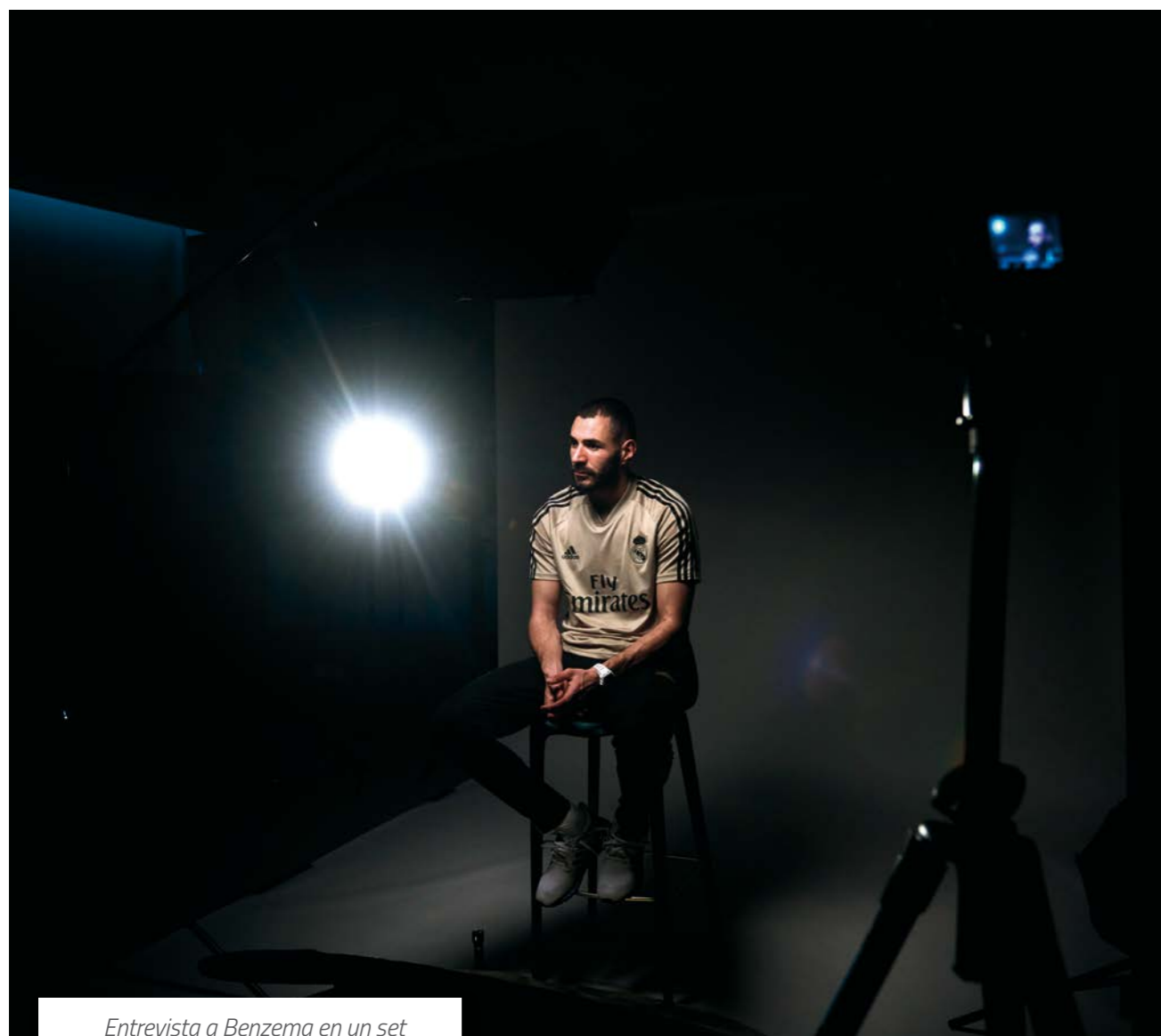
Entrevista a Benzema en un set de RealMadrid TV.

Este año la aplicación ha cambiado 100% su aspecto y mejorado la usabilidad incorporando nuevas formas de gamificación con la primera versión de fanconnect . Se añade la posibilidad de comprar en nuestros bares del estadio, la apertura de sus contenidos sin necesidad de registro y un cambio de diseño. Todas estas novedades se añaden al resto de funciones que socios y Madridistas pueden disfrutar con pocos clics. RealMadrid App está disponible en inglés, español, árabe, indonesio, japonés, portugués, francés y recientemente se ha habilitado el idioma alemán.